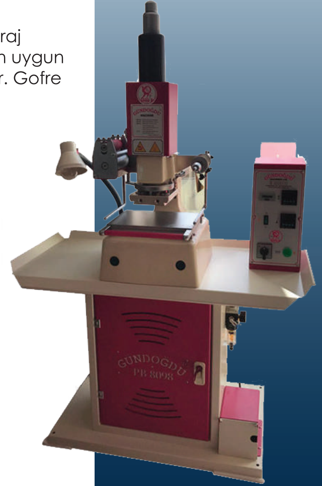
BASKININ SANATA DÖNÜŞTÜĞÜ YER